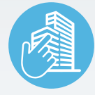
ZIMVIE INSTITUTE PROGRAMS