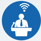
ZI LIVE WEBCASTS