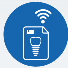
ZI LIVE CASE PRESENTATIONS