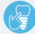
ZIPATHWAYZ ® PROGRAMS