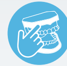
ZI IMPLANT SKILLZ ® SERIES