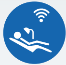
ZI LIVE CLINICAL

Contattaci per avere maggiori informazioni sulle seguenti opportunità educative: